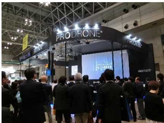
【写真② PRODRONE 社のブース】

会場内で特に見学者が多かった PRODRONE 社（プロドローン社）では、全天候型・物資運搬・農薬散布など様々な用途に対応したドローンが展示されていた。中でも全天候型は、雨天も問題ないため、急な要請にも対応できると感じた。