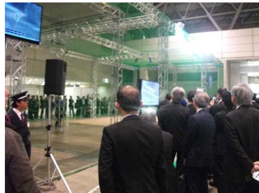
【写真④ デモンストレーションの様子】

特設ブースでは、トレーニングシステムを搭載した練習用のドローンや、燃料電池搭載機体(飛行時間が長く地球に優しい)によるフライトデモ、室内自律飛行による3D マッピングなどのデモンストレーションが行われた。