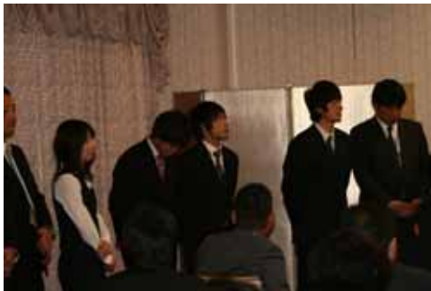
壇上に並ぶ資格取得者の皆様