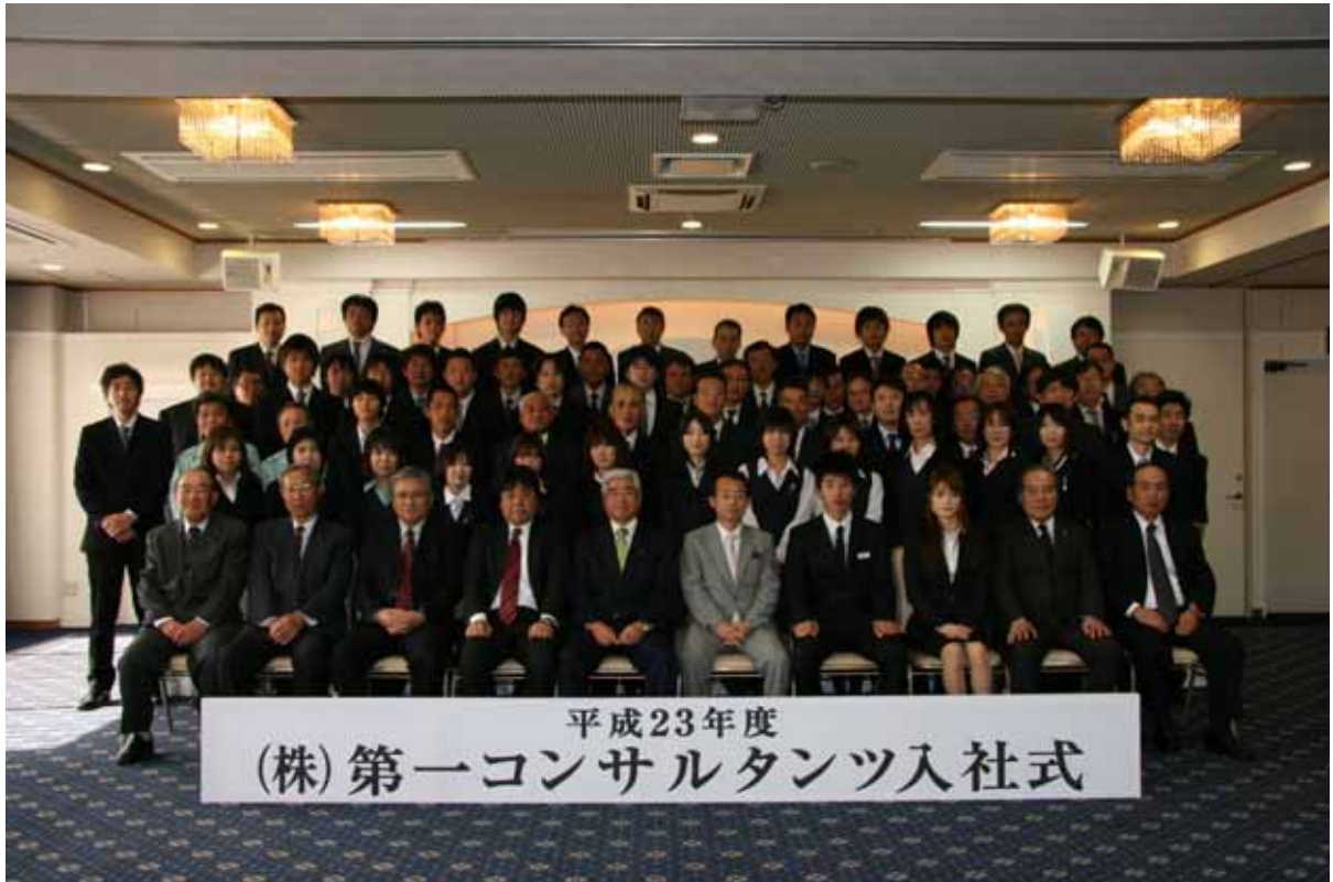
入社式前に行われた記念撮影