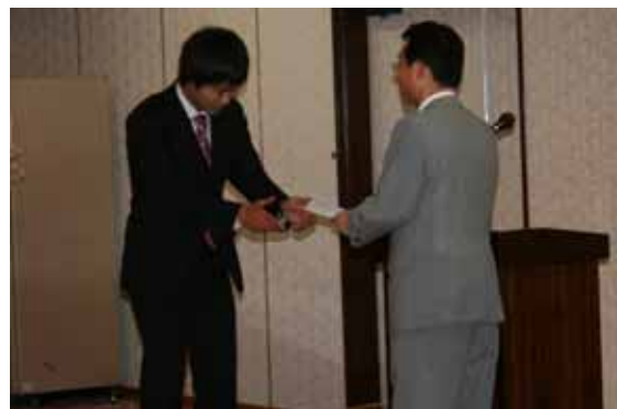
壇上にて手渡してもらいました

平成23年度は、震災の影響で、景気の悪化も考えられますが、これまで以上に情報を共有し、そして知恵を出し合って頑張ってください。