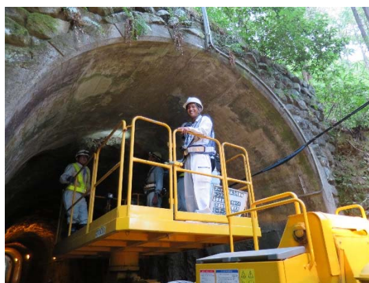
トンネル点検現場にて

2. 3 日目地盤防災課課員とともに、安芸市トンネル点検の現場へと向かった。ネパールは、山に囲まれているため数多くのトンネルがあるらしく、点検方法にとっても興味を示していた。