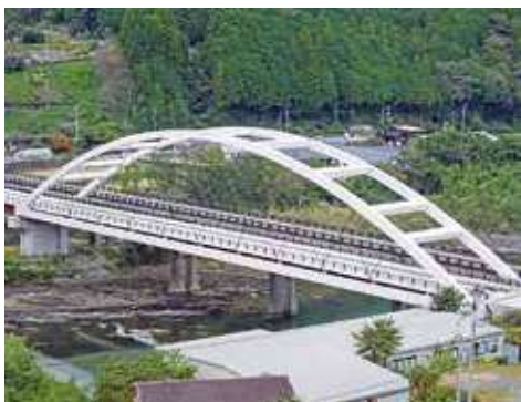
土佐本山橋(本山町) 現地の状況や利用者の利便性を考慮し、経済的で維持管理性に優れた橋梁や一般構造物の計画設計を行います。