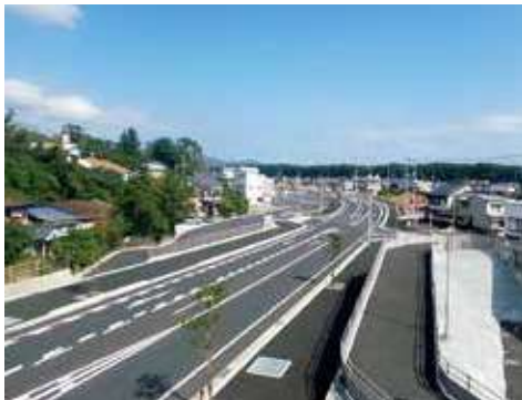
大方改良(中村河川国道事務所) 高規格道路・一般道路など、道路に関する調査・計画・設計を行います。