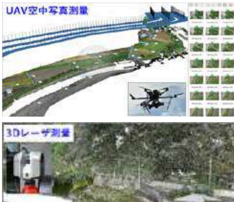
県道奈比賀川北線(高知県安芸土木事務所)

最新の計測機器を使用した3D計測、基準点、水準、地形などの各種測量、交通量、OD、アンケートなどの各種調査業務を行います。