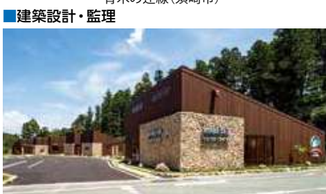
モンベルアウトドアヴィレッジ本山(本山町)