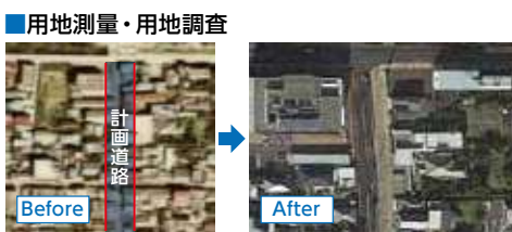
青木の辻線(須崎市)