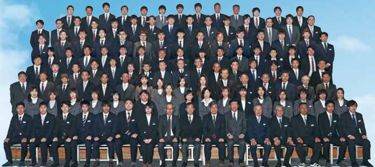
2020年4月1日入社式(社員数142名)