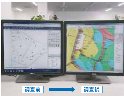
調査前 → 調査後

計画から地籍簿・地籍図の作成まで、豊富な実績と最先端の測量技術により、地籍調査の全工程のサポートを行います。