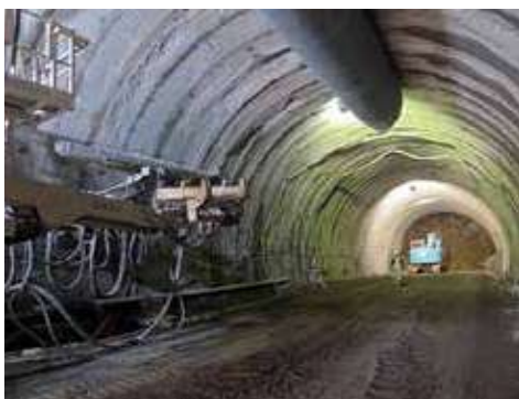
一般国道493号小島トンネル(高知県安芸土木事務所) 複雑な地質状況下で建設されるトンネルについて地質調査、設計、施工に至るまでの高度なコンサルティングを行います。